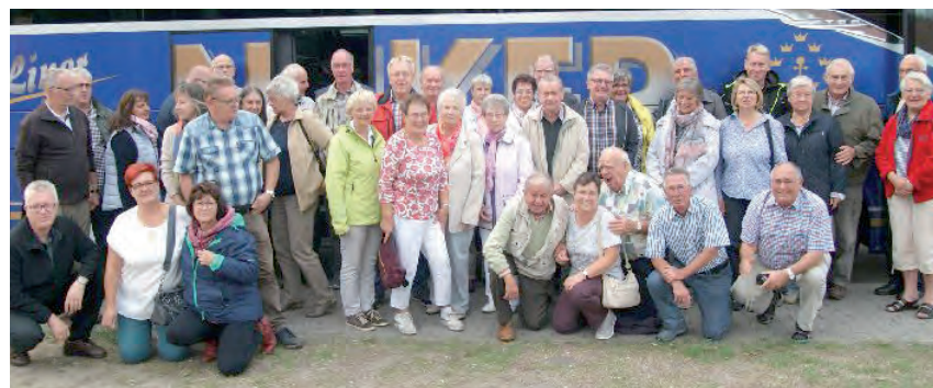
41 Vorstandsmitglieder und Gäste der Kreisgruppe Lüneburg-Uelzen-Harburg/Land reisten kürzlich nach Bad Zwischenahn. In den Mustergärten vom "Park der Gärten" sammelten sie Anregungen für zuhause, bevor sie sich aufs Schiff zur Rundfahrt über das Zwischenahner Meer begaben.