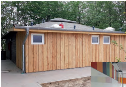
Jahr für Jahr investiert die Stadt Hannover beträchtliche Summen für die Infrastruktur. In frischem Glanz erstrahlt hier beispielsweise ein Sanitärhäuschen.