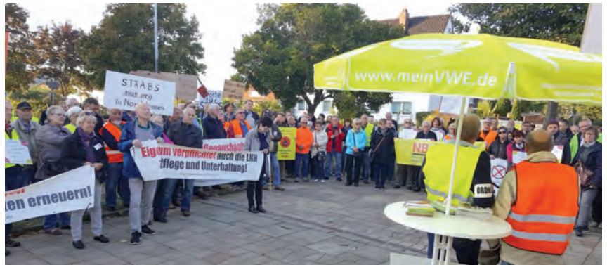
Etwas 320 Hauseigentümer brachte die Gemeinschaft Nordstemmen (Kgr. Hildesheim) gegen die STRABS auf die Straße. Eine beachtliche Zahl. Übertragen auf die Bundeshauptstadt Berlin wären dies knapp 90.000 Demonstranten.

Art und Weise, wie gewählte Vertreter des Rates mit den Anliegen der Bürger umgingen. "Stichhaltige Argumente werden einfach vom Tisch gefegt, Absprachen hinter verschlossener Tür getroffen und Fronten gegen die Interessen der Bürger aufgebaut". Dies führt seiner Ansicht nach zu Wut, Frust und Politikverdrossenheit. Ans Aufgeben denke er noch lange nicht. Zusammen mit den Hauseigentümern werde er weiter öffentlichen Druck ausüben. "Sonst sind wir hier in Nordstemmen bald die Dummen, wenn sich die benachbarten Gemeinden für die Abschaffung entscheiden".