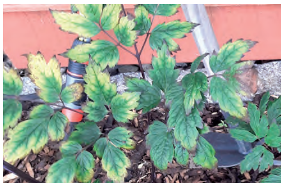
Die September-Silberkerze zeigt deutliche Symptome. Die VWE-Gartenberatung gibt Tipps.